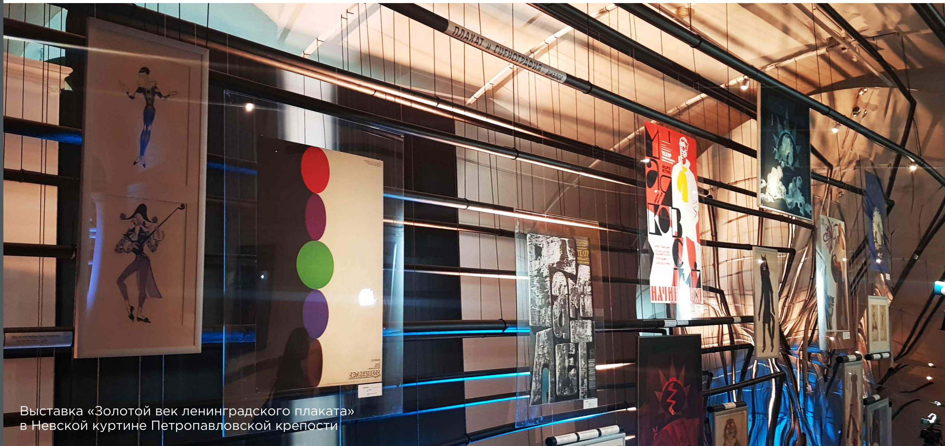
Выставка «Золотой век ленинградского плаката» в Невской куртине Петропавловской крепости

ОФОРМЛЕНИЕ ЭКСПОЗИЦИЙ: НАШИ ПРЕИМУЩЕСТВА