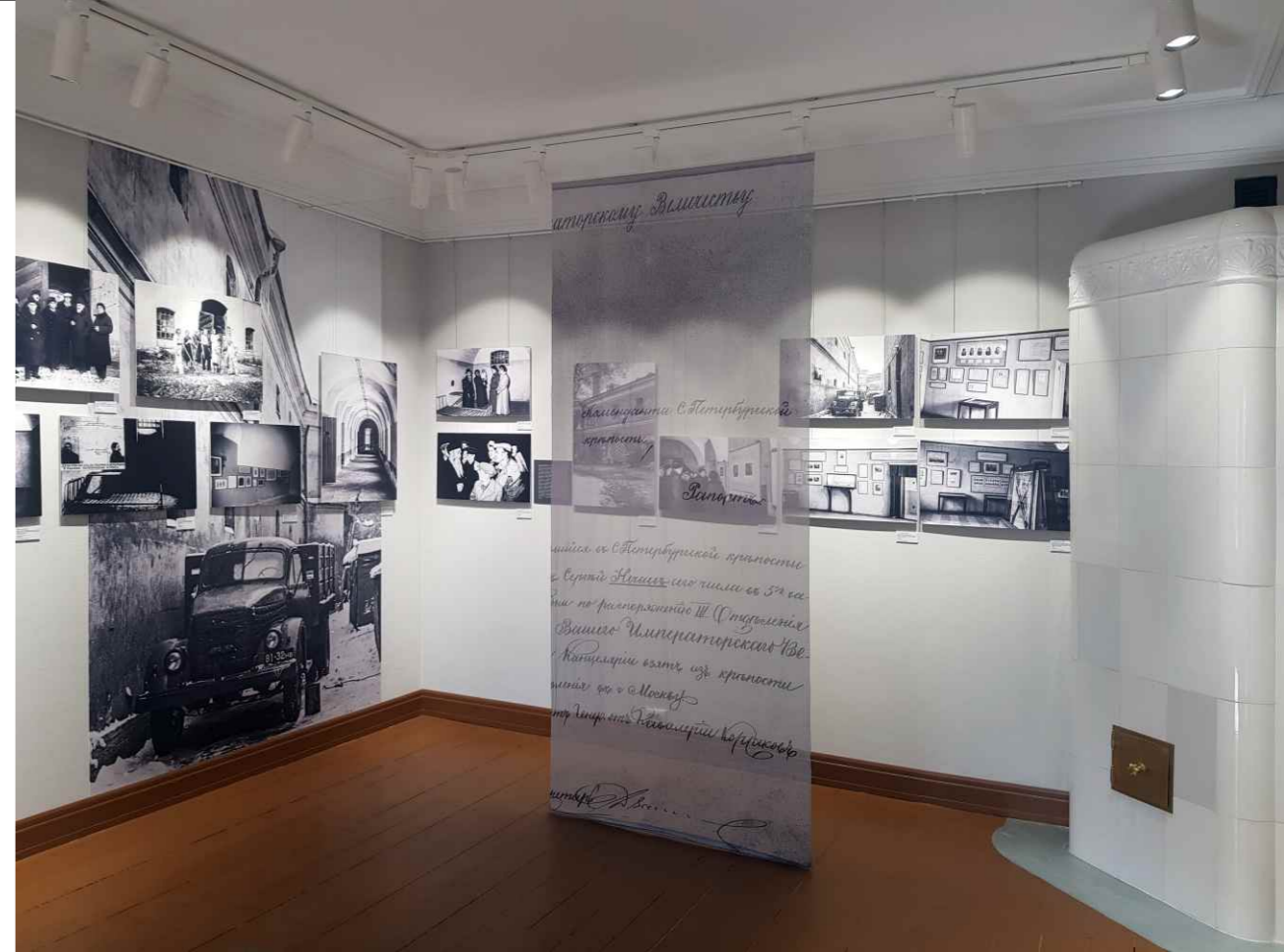
Отсканировали и обработали архивные фотографии из фондов Музея истории Санкт-Петербурга, напечатали и развесили их в здании тюрьмы Трубецкого бастиона, дополнили выставку крупными фотопанно и изображениями на ткани.