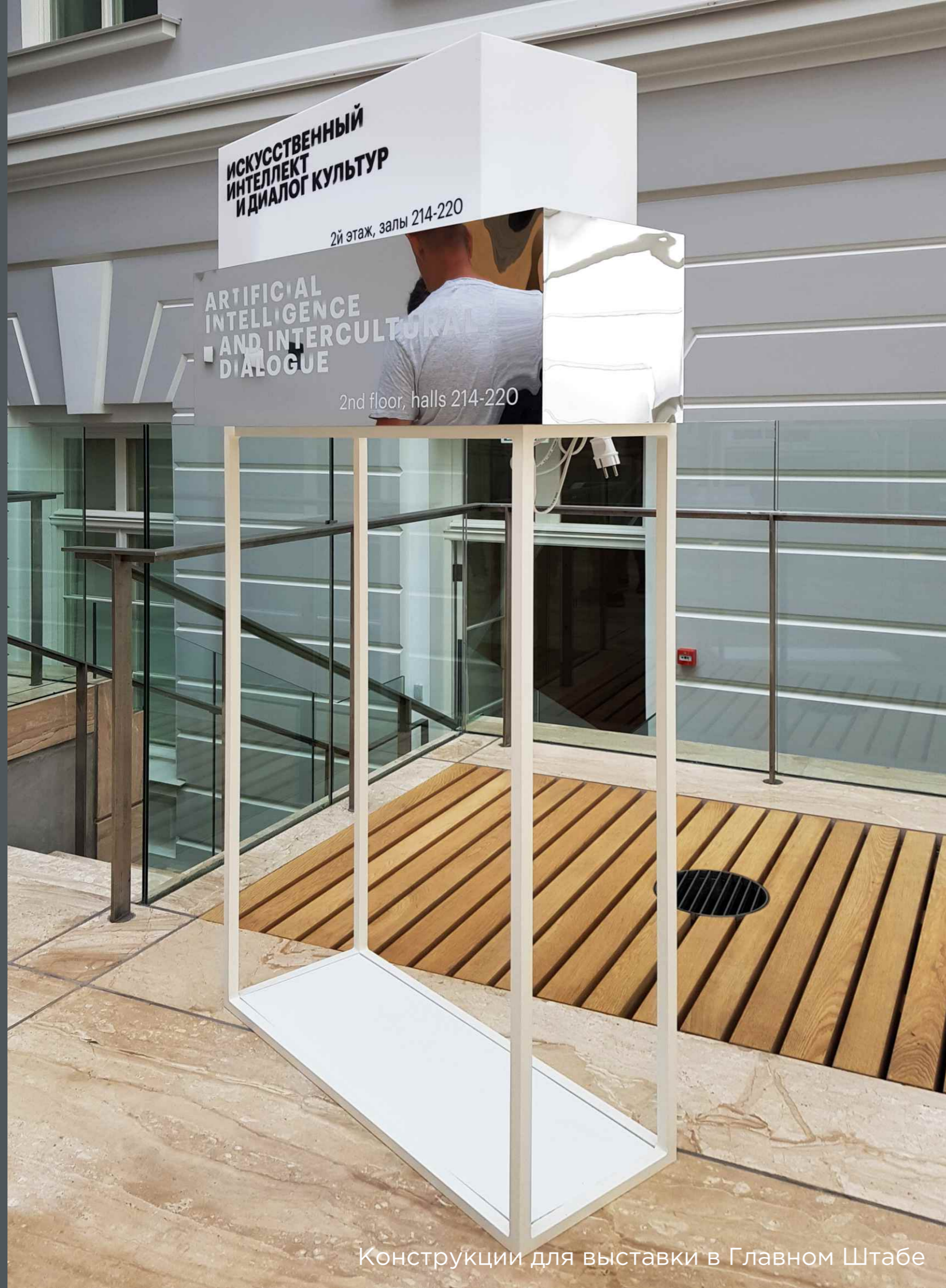
Конструкции для выставки в Главном Штабе

Наш опыт работы по оформлению выставочных экспозиций позволяет нам браться за любые, самые смелые проекты. Мы можем придумать, нарисовать, спроектировать и воплотить музейную экспозицию любой сложности и нетривиальности.