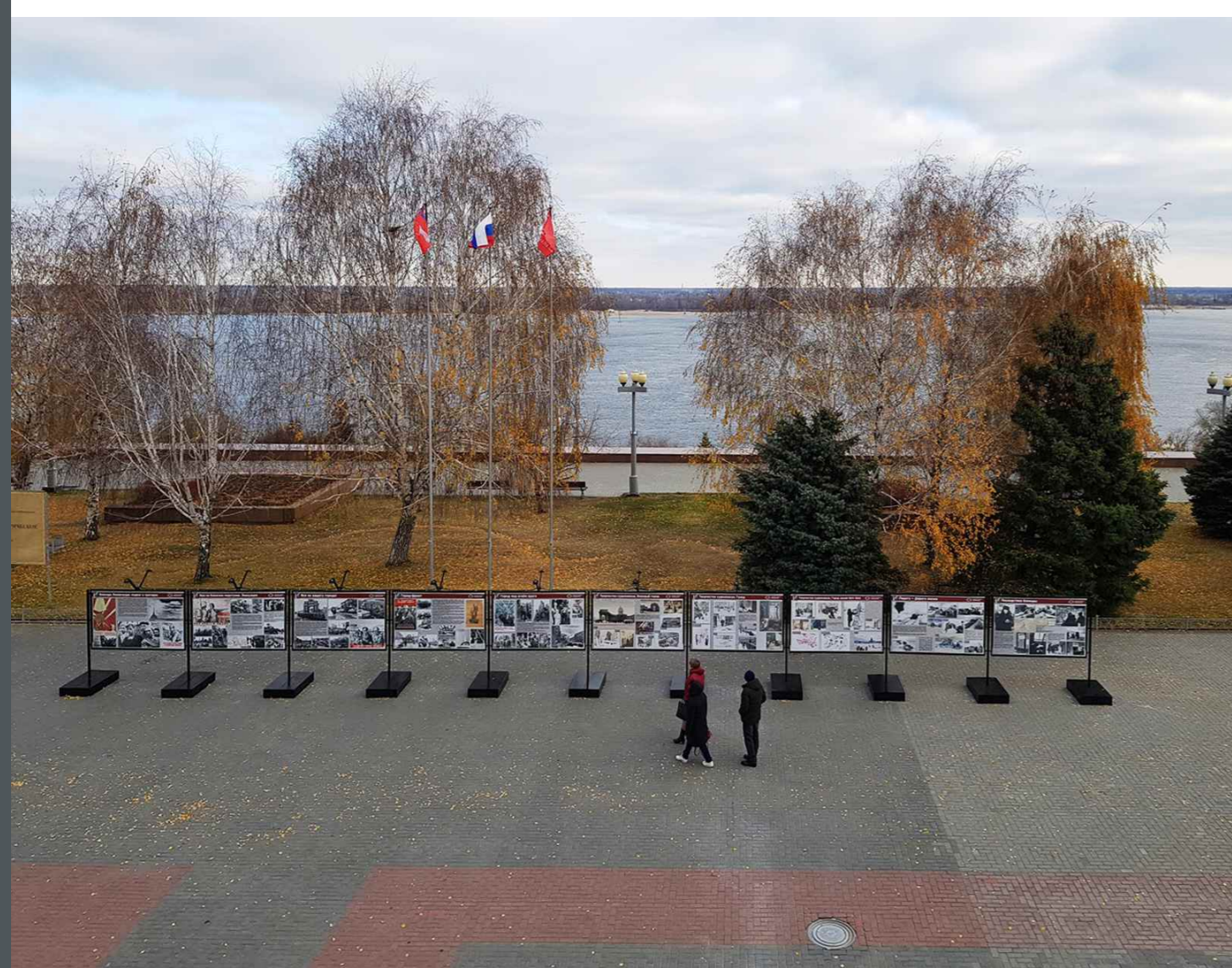
На основании архивных фотографий создали дизайн выставочных стендов, напечатали изображения на металлокомпозите методом УФ-печати, транспортировали панели в Волгоград, смонтировали их и установили стенды на берегу Волги рядом со зданием Музея-панорамы «Сталинградская битва».